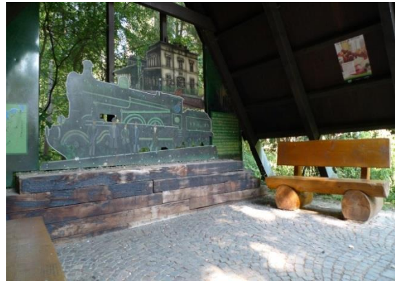
Foto 5 NBDS monument

Direct achter Steintor: RA, Gärtnerweg (begint als voetpad) Na bocht LA, Kastellstrasse (begint als voet- fietspad) Hier stond vroeger het Kasteel van Goch Voorbij museum RA voorbij slagboom Am Vosstor LA, Vossheider Strasse (over spoor) RD, Vossheider Strasse RD, Kalbecker Strasse RD, Kalbecker Strasse RA, Höst-Vornicker-weg Op gelet! U steekt de drukke Uedemerstrasse over RD, Höst-Vornicker-weg